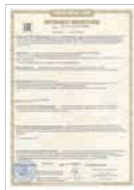
Сертификат ЕАС (Таможенный Союз)