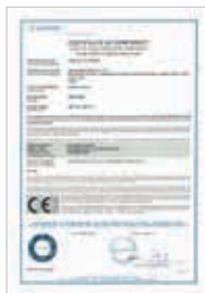
Сертификат CE (Евросоюз)